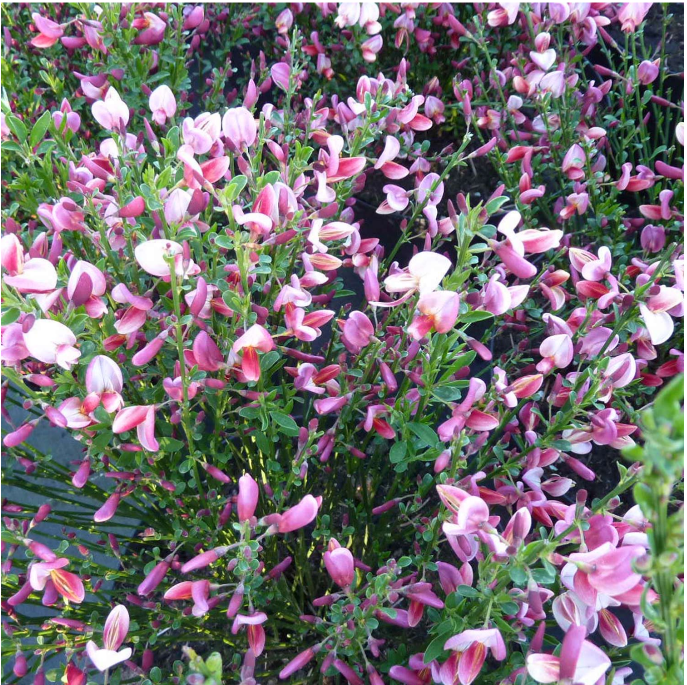
Purpurginster (Rosenginster) Liefergröße: 30 - 40 cm - Cytisus purpureus

Dieser Purpurginster ist außerordentlich blühfreudig und wie der Name schon erahnen lässt, erstrahlt die Blüte im Mai und Juni in herrlichen Purpur-Nuancen. Sein lockerer, buschiger Wuchs macht ihn besonders vielseitig. Mit einer Höhe von ca. 50 cm und einer Breite von 80 cm eignet er sich nicht nur für Einzel- und Gruppenpflanzungen, sondern auch für der Größe entsprechende Pflanzkübel. Sein Laub hat ein kräftiges Grün und wird im Herbst abgelegt. Der Rosenginster bevorzugt, so wie alle Ginster, eher sandigen Boden. Zudem ist der Rosenginster anspruchslos und schnittverträglich.