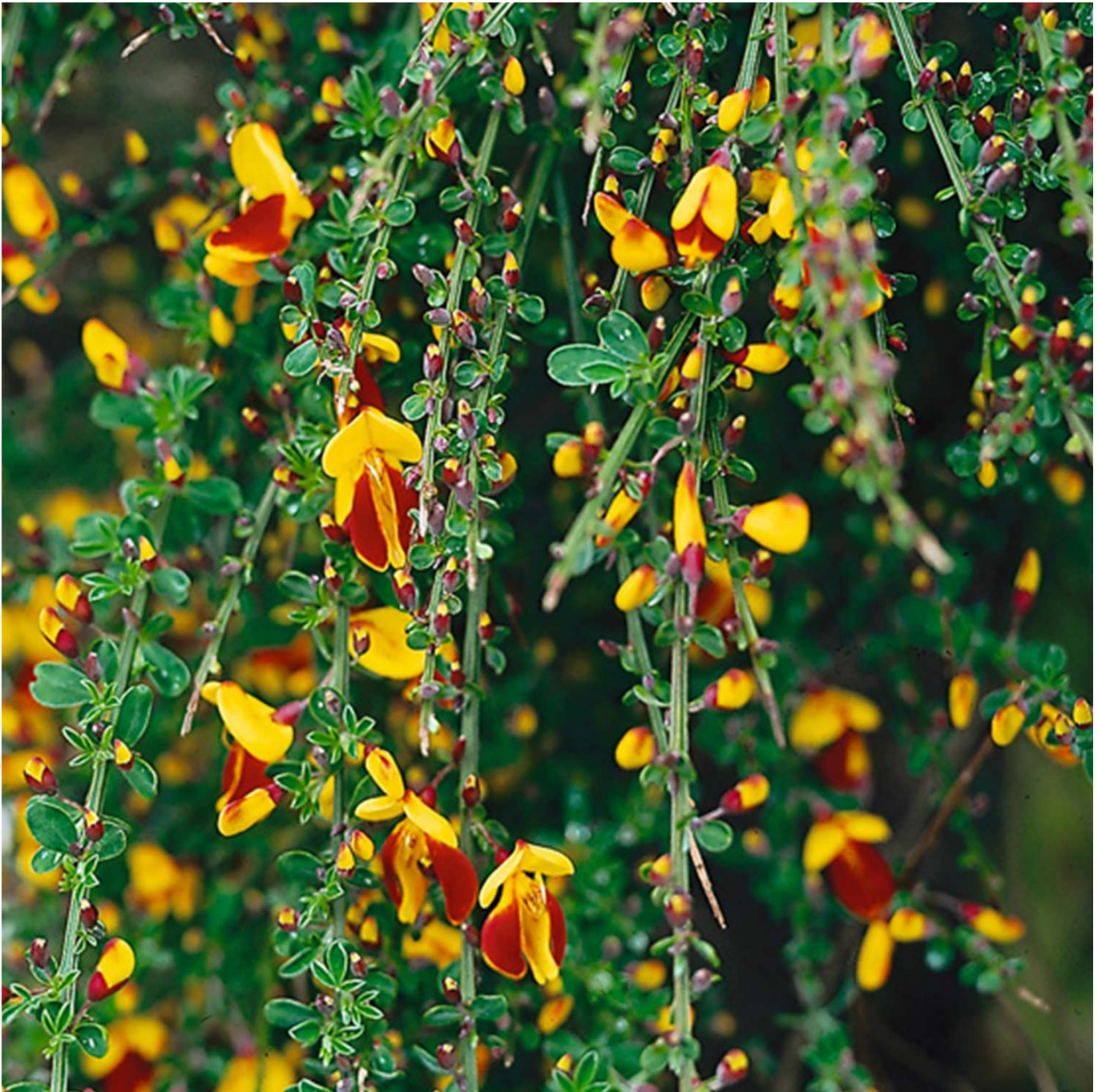
Edelginster 'Andreas Splendens' Liefergröße: 40-60 cm - Cytisus scoparius 'Andreas Splendens'

Der Edelginster 'Andreas Splendens' ist eine der schönsten Ginstersorten und sehr beliebt. Die Blüten haben eine signalgelbe Fahne, umgeben von rotbraunen Flügeln, an dessen Rahmen man die gelbe Farbe aus der Fahne wiederentdeckt. Das Farbspiel, das sich durch diese Kombination ergibt, ist sehr sehenswert und zeigt sich von Mai bis Juni. Der Wuchs des Edelginsters "Andreas Splendens" ist breitbuschig und aufrecht, er wächst ca. 1,5 Meter in die Höhe und Breite.